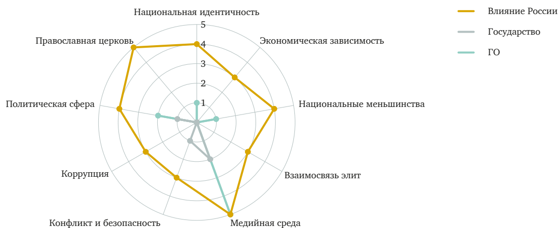
Схема 2: Факторы влияния России в Беларуси и реагирование со стороны государства / гражданского общества

На схеме отражены уровни различных факторов уязвимости для влияния России в соответствии с оценками экспертов по шкале от 0 до 5, где 0 = 'отсутствует', 1 = 'минимальный', 2 = 'умеренный', 3 = 'существенный', 4 = 'критический' и 5 = 'доминирующий'. Реагирование со стороны государства и гражданского общества оценено по шкале от 0 до 5, где 0 = 'реагирование отсутствует', 1 = 'минимальное реагирование', 2 = 'мягкое реагирование', 3 = 'умеренные усилия', 4 = 'существенные усилия' и 5 = 'действенные усилия на высоком уровне'.