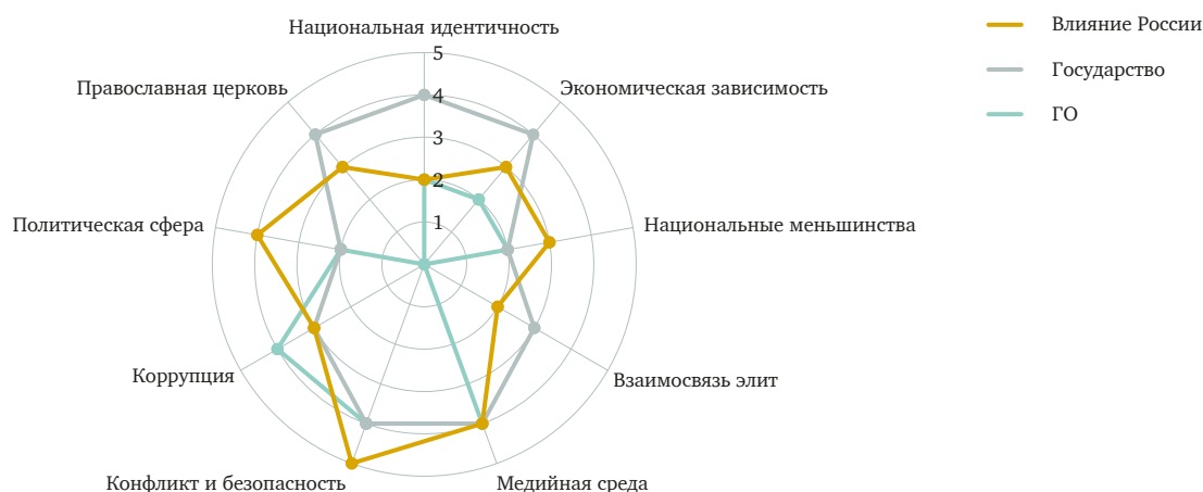
Схема 1: Факторы влияния России в Украине и реагирование со стороны государства / гражданского общества

Источник: На основе интервью с экспертами в анализируемых странах. На схеме отражены уровни различных факторов уязвимости для влияния России в соответствии с оценками экспертов по шкале от 0 до 5, где 0 = 'отсутствует', 1 = 'минимальный', 2 = 'умеренный', 3 = 'существенный', 4 = 'критический' и 5 = 'доминирующий'. Реагирование со стороны государства и гражданского общества оценено по шкале от 0 до 5, где 0 = 'реагирование отсутствует', 1 = 'минимальное реагирование', 2 = 'мягкое реагирование', 3 = 'умеренные усилия', 4 = 'существенные усилия' и 5 = 'действенные усилия на высоком уровне'.